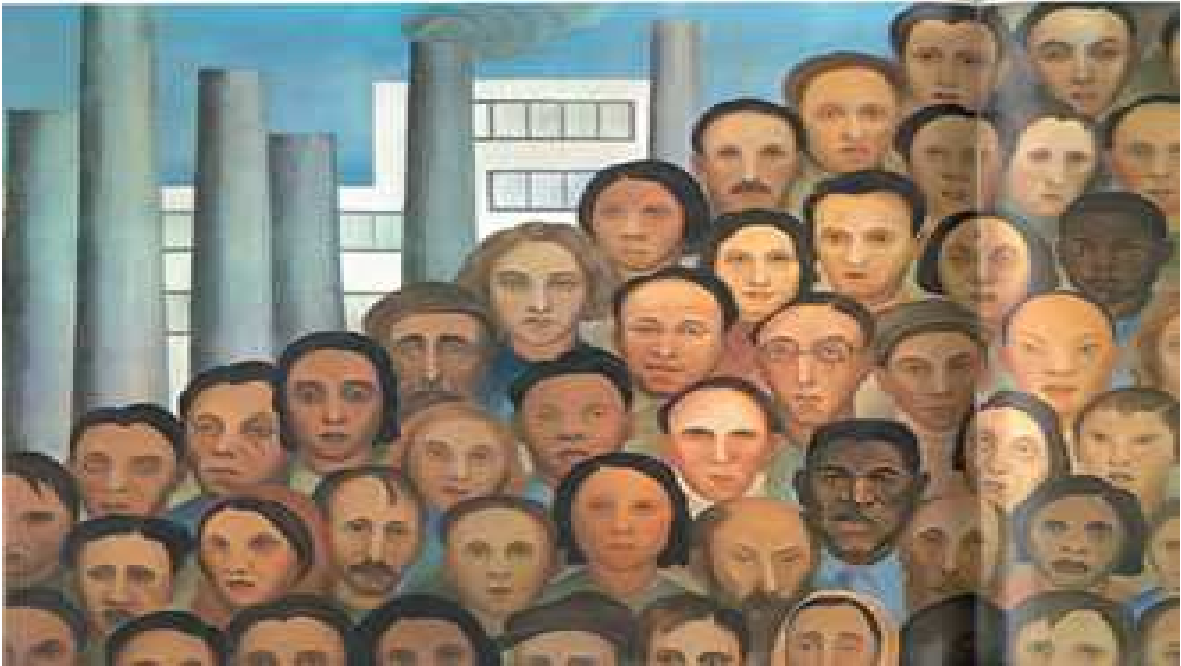
Tarsila do Amaral