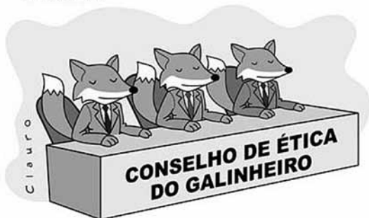
[CHARGE] Conselho de ética do galin