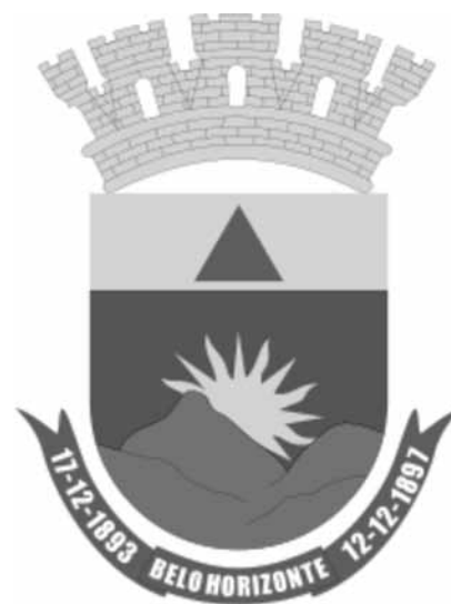
Brasão de Belo Horizonte

Leia e atente para as informações a respeito do Brasão de Belo Horizonte, pois as questões 06 e 07 são referentes a elas: