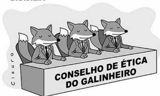
[CHARGE] Conselho de ética do galin