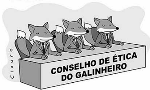
[CHARGE] Conselho de ética do galin