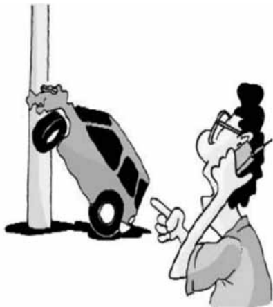
Imagem extraída do Livro Noções de primeiros socorros no trânsito , capítulo 2, (2005).

Analisar a imagem e enumerar a sequência CORRETA , em relação à ação do socorrista, quando evidencia o que o fato abaixo demonstrou.