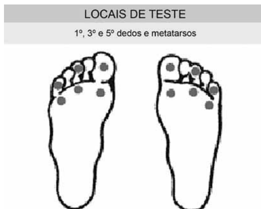
Imagem extraída do Protocolo de Diabetes Mellitus (2010) da Secretaria de Saúde de Belo Horizonte, p. 66.

Considerando o trecho acima e a imagem que se segue: