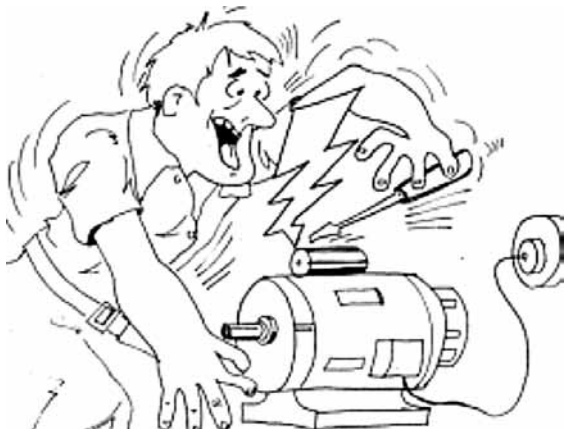
Imagem disponível em < http://www.portalsaofrancisco.com.br/alfa/choque-eletrico/choque-eletrico-2.php > acessado em 04/10/2011.

Baseando-se na informação da imagem, marque a alternativa CORRETA , quanto a sequência das ações a serem realizadas ao atender a vítima deste acidente: